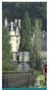
La belle au Bois n°21