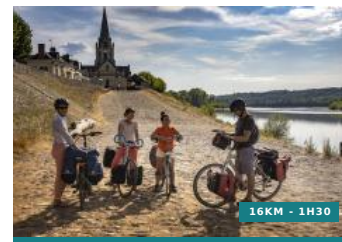
De port en port - Circuit n°19