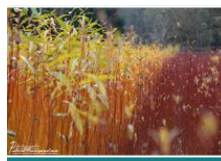
L'osier de Gué droit