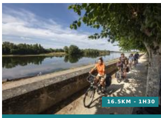
Au fil de l'eau - Circuit n°20