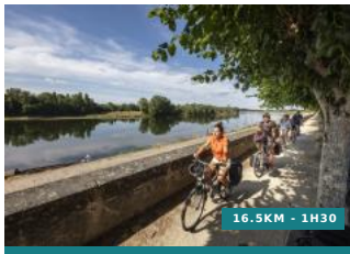
Au fil de l'eau - Circuit n°20