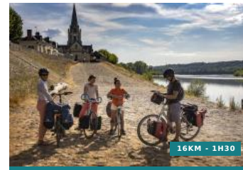
De port en port - Circuit n°19