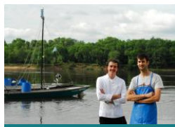
La Cabane à matelot