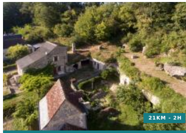
De l'osier au panier - Circuit n°18