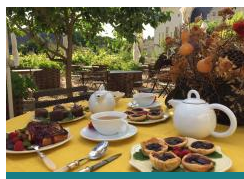
La Table des Fées