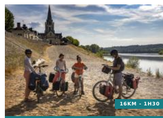
De port en port - Circuit