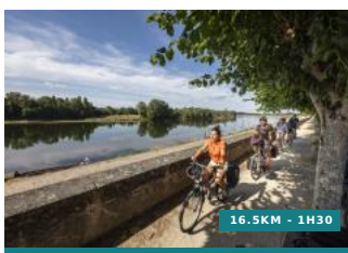
Au fil de l'eau - Circuit n°20