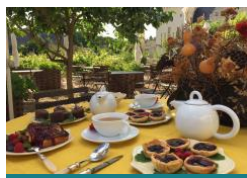
La Table des Fées