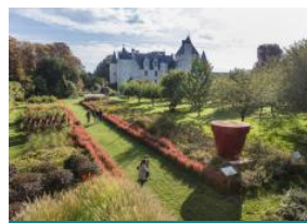
Château et Jardins du Rivau