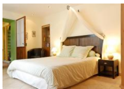
La Closerie Saint Martin