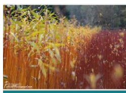
L'osier de Gué droit