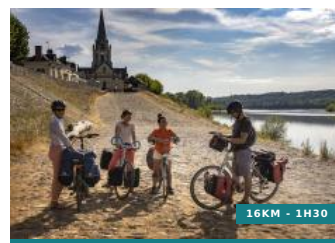
De port en port - Circuit n°19