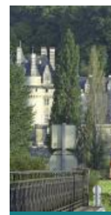
La belle au Bois n°21