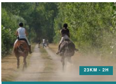
Sur les traces de Rabelais