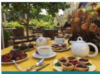
La Table des Fées