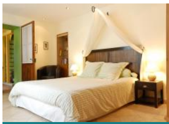
La Closerie Saint Martin