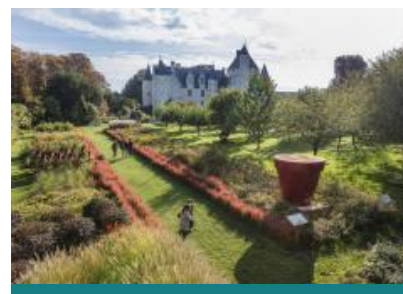
Château et Jardins du Rivau