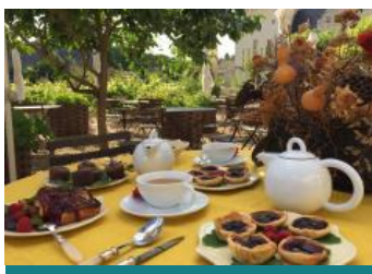
La Table des Fées