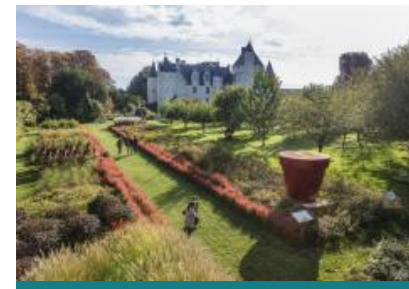
Château et Jardins du Rivau