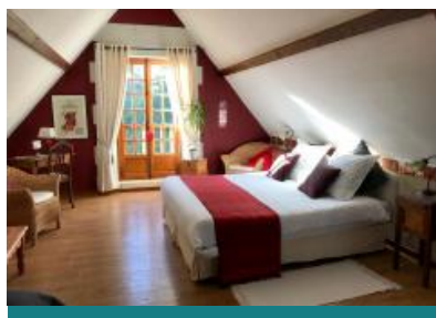
Domaine de Joreau