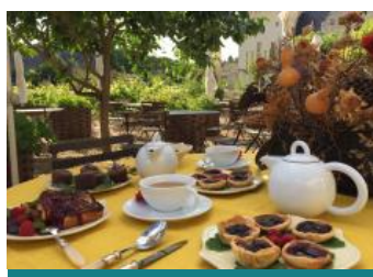
La Table des Fées