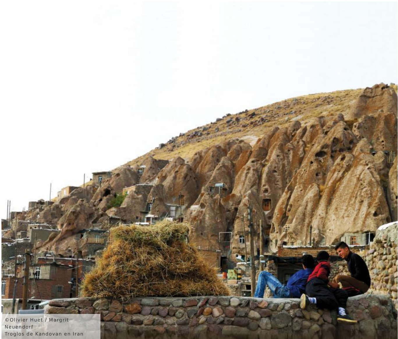
Troglos de Kandovan en Iran