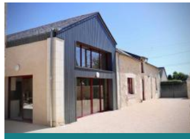
Au Logis du Prévôt