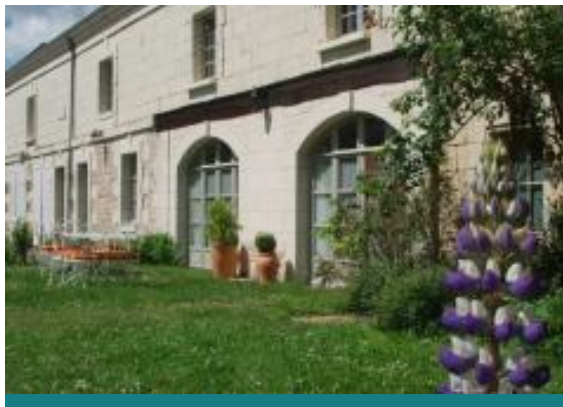
Le Logis des roches d'antan