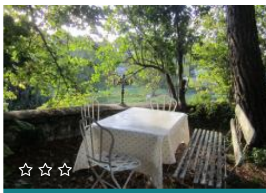
Logis du Bourg Neuf