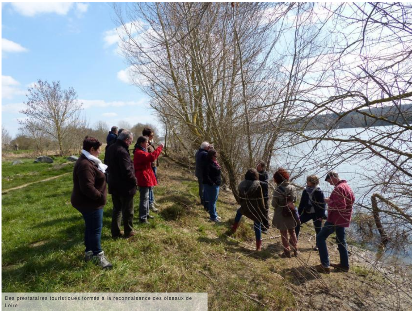
Des prestataires touristiques formés à la reconnaissance des oiseaux de Loire