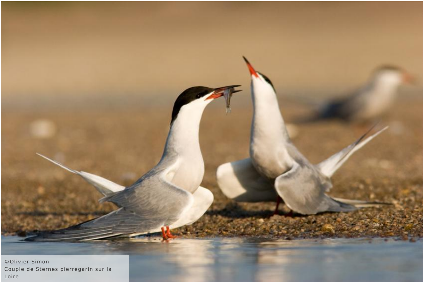
Couple de Sternes pierregarin sur la Loire

Le site Natura 2000 est aussi une zone importante pour l'avifaune migratrice, plus de 30 espèces d'oiseaux patrimoniales telles que les Sternes pierregarin ou le Balbuzard pêcheur y sont présentes et en dépendent.