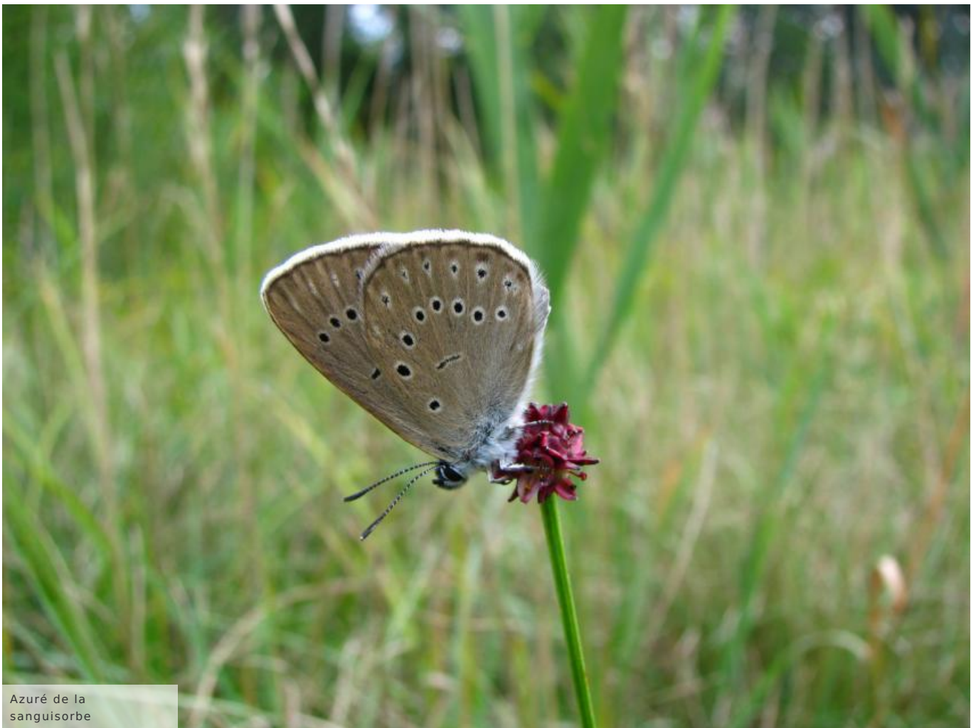
Azuré de la sanguisorbe

Quelques marais tourbeux subsistent dans certains secteurs et abritent la Samole de Valérand ou le Rossolis à feuilles rondes . En gagnant les plateaux, la présence de plans d'eau et de landes à bruyères contribuent au développement d'une faune et une flore riches en espèces patrimoniales (Flûteau nageant, Bruyère ciliée, Gentiane des marais, Azuré des mouillères...).