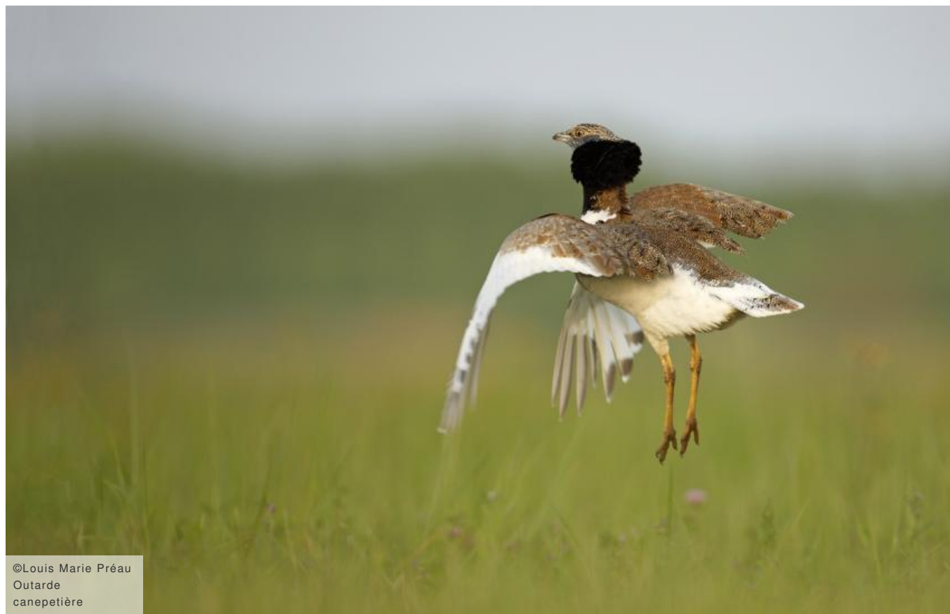
Outarde canepetière

Les prairies, les terres cultivées et les jachères qui se côtoient constituent un milieu ouvert favorable à de nombreuses espèces d'oiseaux protégés par l'Union Européenne : Busard cendré, Outarde canepetière ou Oedicnème criard y trouvent une réserve alimentaire riche et variée et des zones de reproduction. Découvrez la beauté naturelle du Parc naturel régional Loire-Anjou-Touraine en France et profitez des activités en plein air offertes.