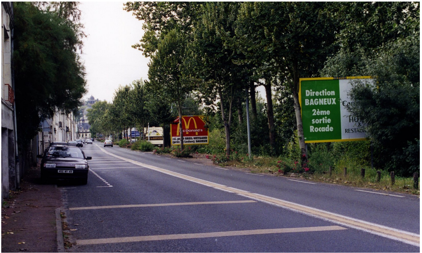
Entrée de ville avant réglementation