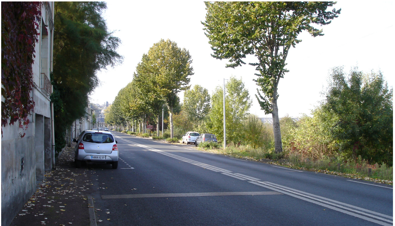
Même entrée après