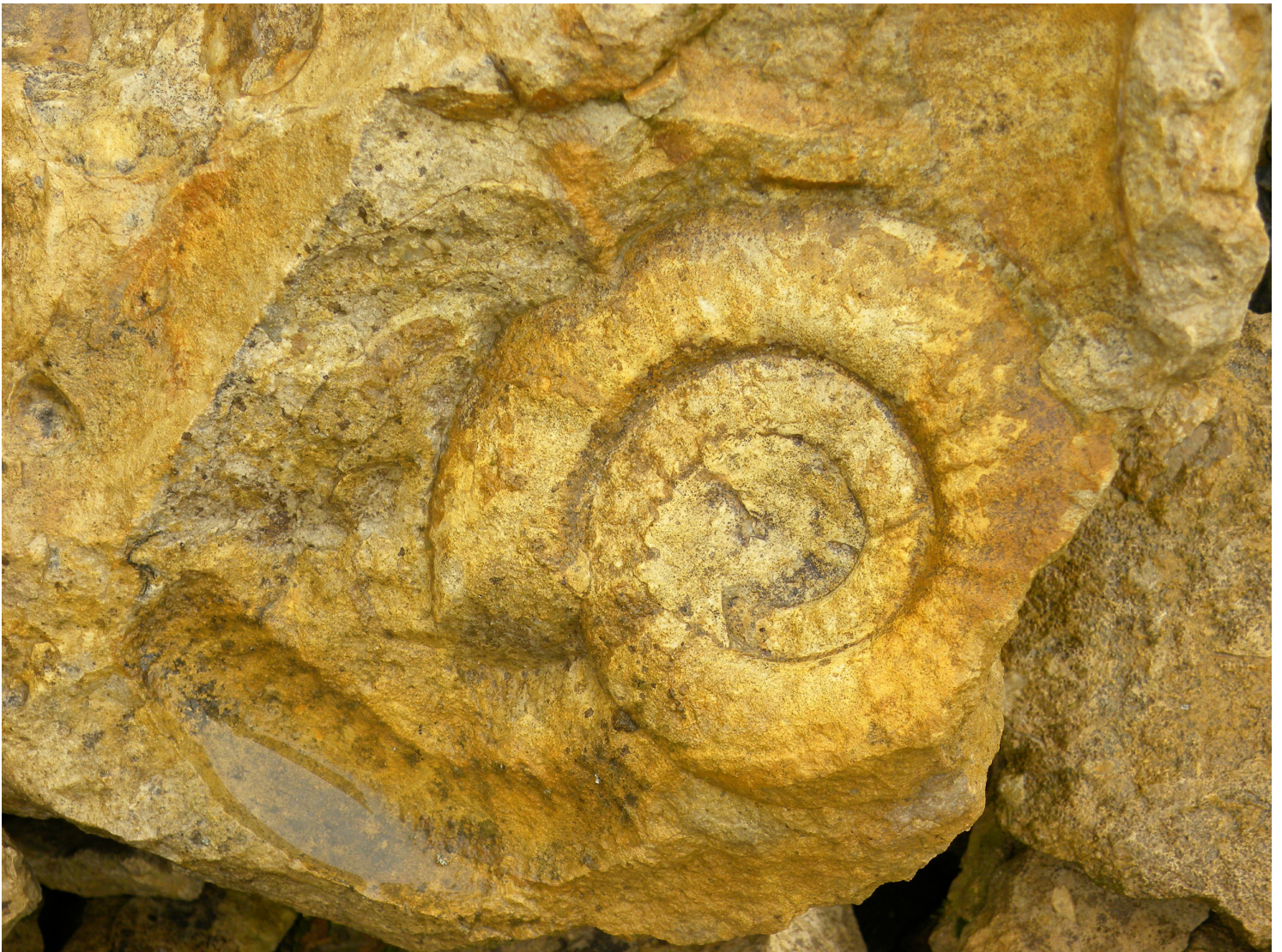
Fossile à Méron, richesse géologique

146 hectares sont protégés par ce classement, localisés au cœur même de la zone industrielle et une petite partie sur l'espace agricole. Au sein de la RNR, les activités sont réglementées, d'autres sont interdites comme celle de porter atteinte aux espèces animales ou végétales ou d'utiliser des produits phytosanitaires sur les parcelles classées. Grâce à ce classement, différents programmes de conservation vont pouvoir être mis en place avec les acteurs locaux, propriétaires et exploitants et des fonds spécifiques vont pouvoir être levés pour des actions de suivi et de gestion.