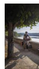
Au gré de la

ATTELAGE A VTT ET A CHEVAL FORÊT La Breille-les-Pins