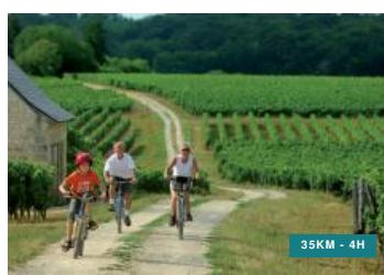
Entre forêts et clairières

ATTELAGE A VTT ET A CHEVAL FORÊT Bourgueil