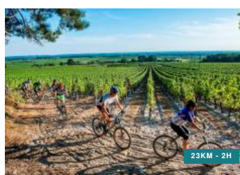
Entre vignes et forêts

ATTELAGE A VTT ET A CHEVAL FORÊT Bourgueil