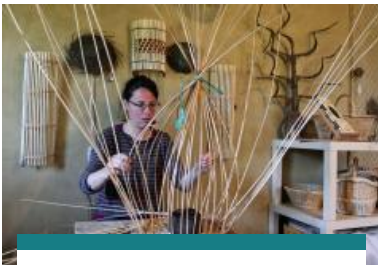
Atelier Brins de Malice