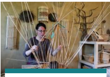
Atelier Brins de Malice