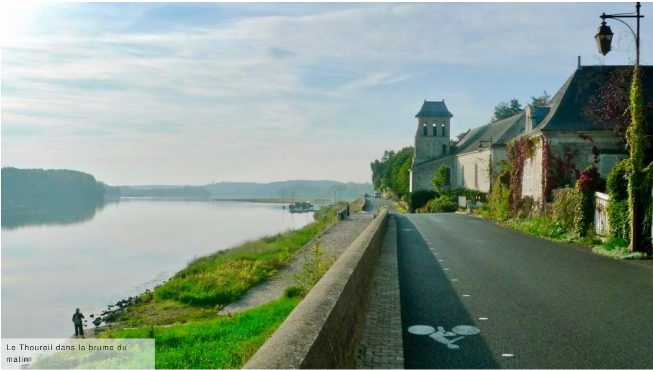
Le Thoureil dans la brume du matin