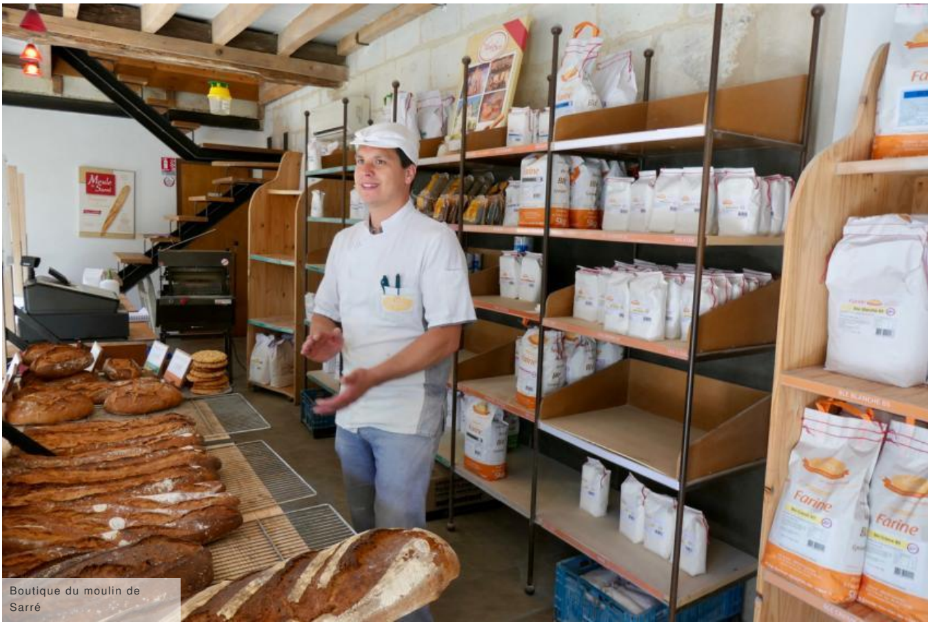
Boutique du moulin de Sarré