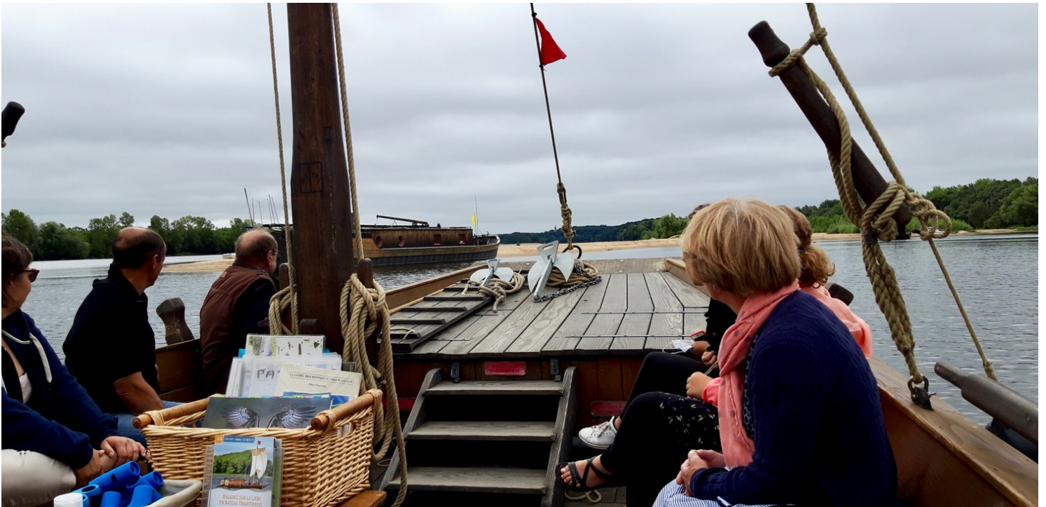
Toue Rêve de Loire