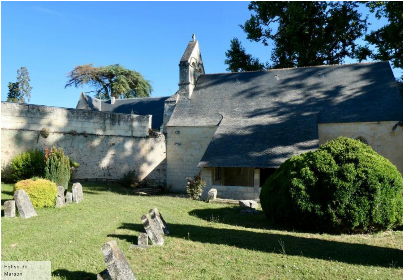
Eglise de Marson