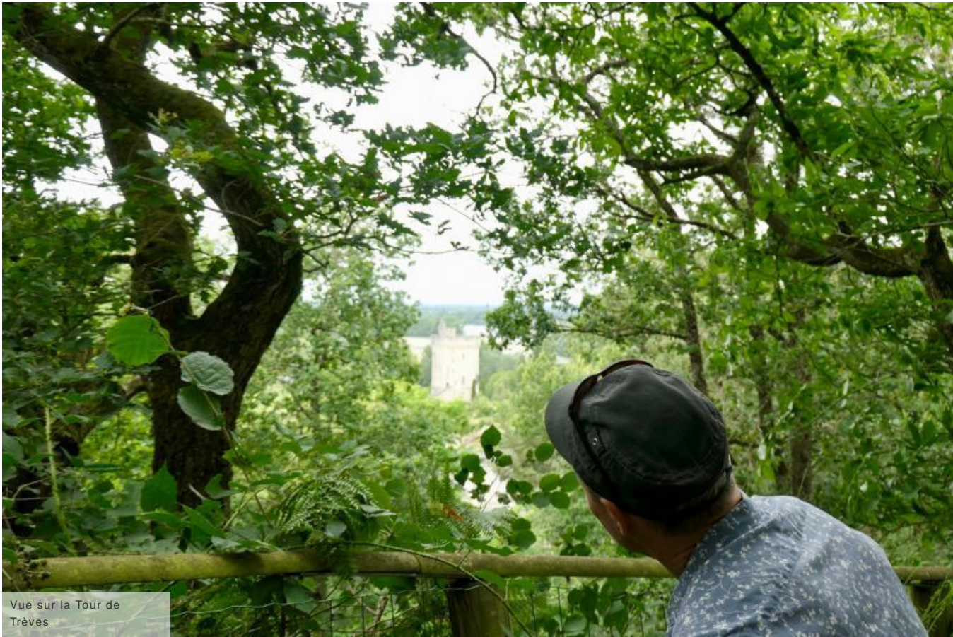
Vue sur la Tour de Trèves