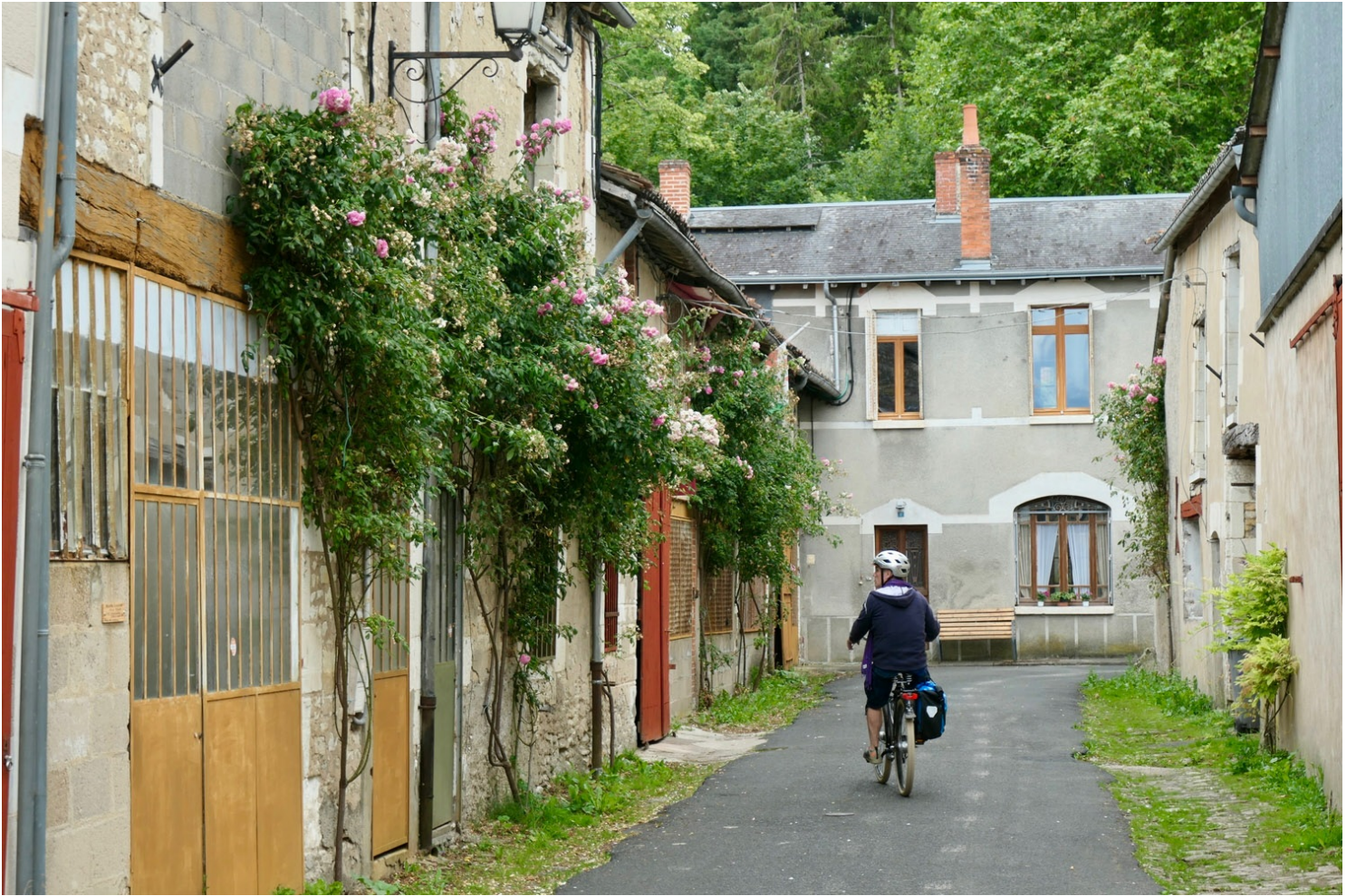
Ruelles de Richelieu et portes peintes