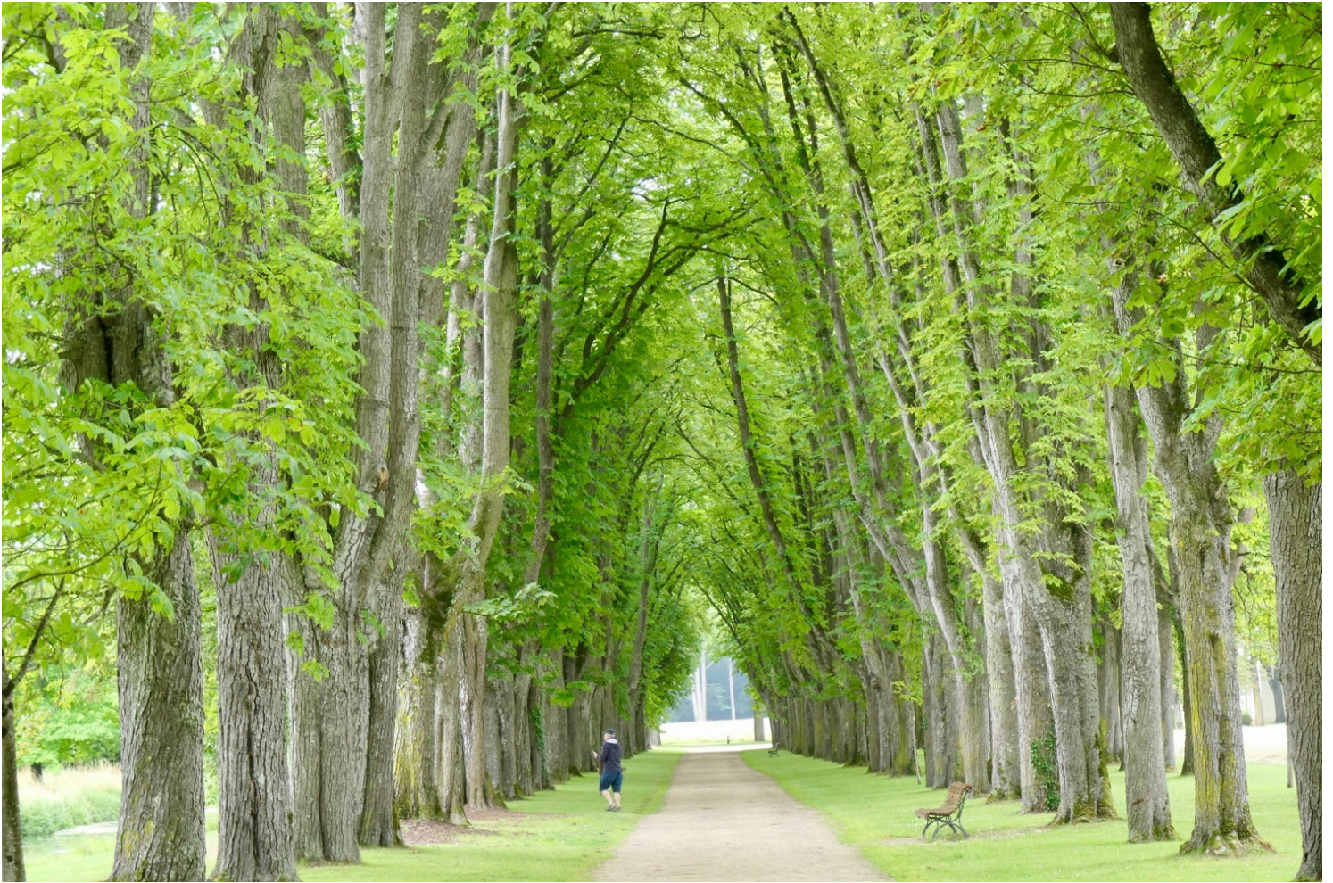
Allée du parc de Richelieu

Nous poursuivons la visite dans l'immense parc de Richelieu en prévision d'une pause au bord de l'eau. C'est ici que fut bâti le plus grand château de France jamais construit avant Versailles, vers 1630. Démoli au 19 e siècle, il n'en reste qu'un dôme, l'orangerie et le chai. Il a été reconstitué en trois dimensions dans l' Espace Richelieu , un hôtel particulier où une scénographie ludique et interactive présente le cardinal.