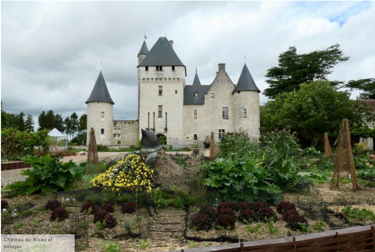
Château du Rivau et potager

Oubliez les visites de châteaux traditionnels ! Passé l'entrée, nous sommes accueillis par une taupe géante qui émerge du "Potager de Gargantua", non loin du restaurant locavore, La Table des fées . C'est justement la pause déjeuner !