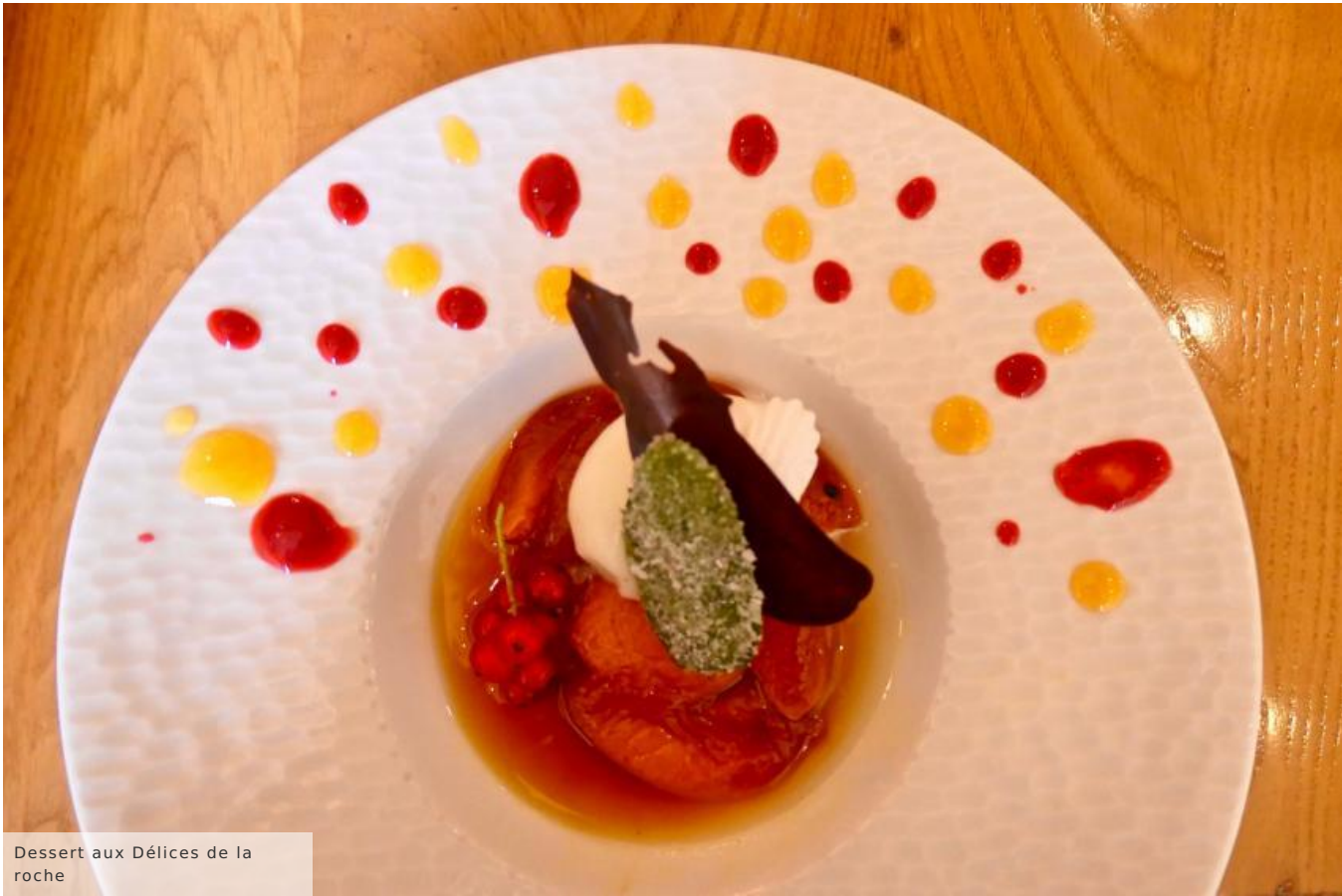
Dessert aux Délices de la roche