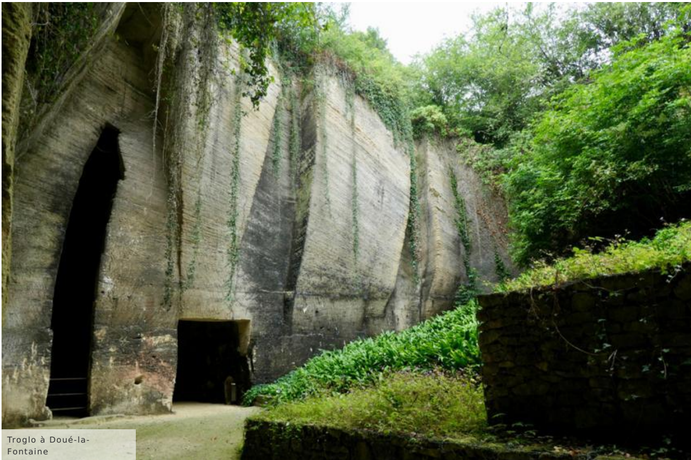
Troglo à Doué-la-Fontaine