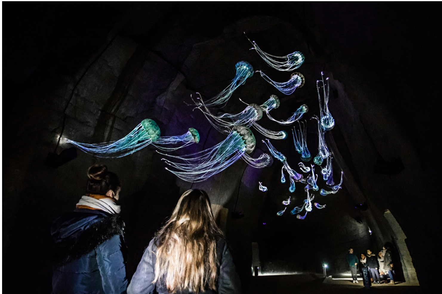
Scénographie du Mystère des faluns