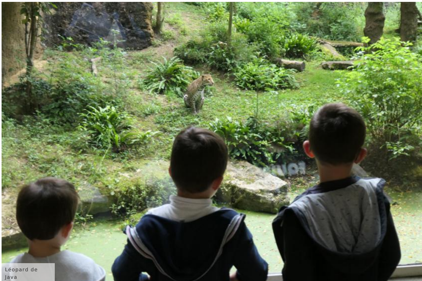
Léopard de Java

Derrière la vitre protectrice, impossible, en revanche, de rater les léopards de Java, imposants félins au regard hypnotique.