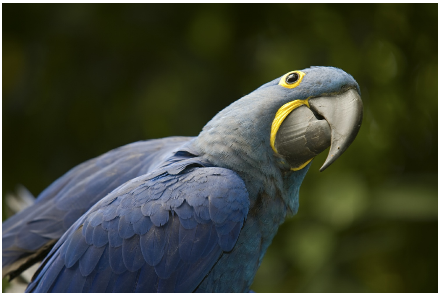
Ara hyacinthe

Outre des flamants du Chili, des spatules roses..., on peut y croiser sept espèces de perroquets, parmi lesquels le magnifique ara hyacinthe, d'un bleu éclatant, et l'ara à ailes vertes. À certaines heures (indiquées à l'entrée), il est possible d'assister à leur nourrissage. Cacophonie garantie ! L'ambiance sonore est étonnante.