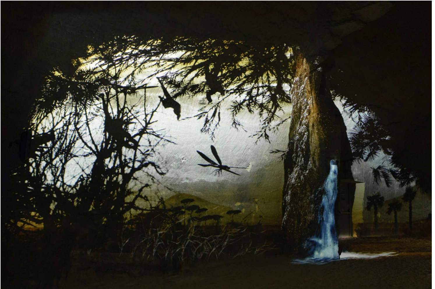
Scénographie du Mystère des faluns

Nous déambulons dans la savane du Miocène où s'orchestre un savant jeu d'ombres et de lumière. Nous sommes suspendus entre terre et mer, emportés dans un songe, happés par la mémoire du falun. Vision fugace d'un requin, traversée des vestiges d'une baleine, et nous voilà propulsés de nouveau à l'époque des carriers. L'hiver, ces paysans ouvraient de fines tranchées dans leurs champs pour en extraire la pierre et améliorer l'ordinaire.