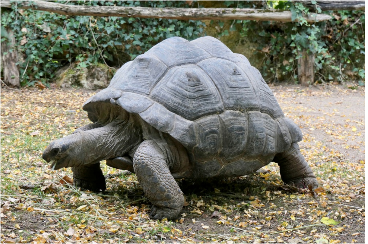
Tortue des Seychelles