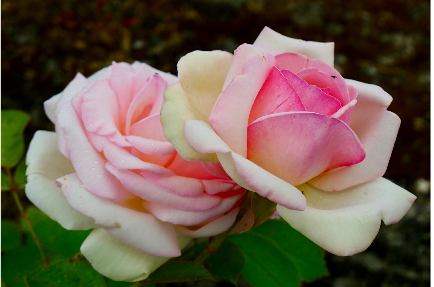
Roses à Doué

Au n° 44 de la rue des Arènes, notez au passage cette maison de rosieriste typique du 19 siècle , construite avec des pierres de falun extraites du dessous.