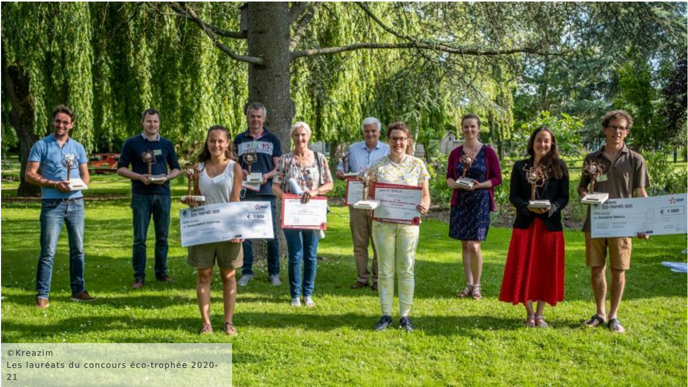
Les lauréats du concours éco-trophée 2020-21