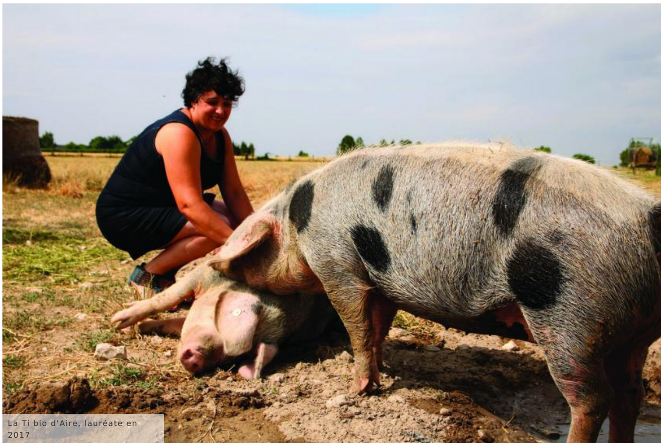
La Ti bio d'Aire, lauréate en 2017

Chacune des 3 catégories ouvertes est dotée de 1 000 € pour le 1 er prix ainsi que de trophées originaux réalisés par deux artisans d'art. Des lots seront également offerts aux salariés ou agents des structures obtenant un 2 ème ou un 3 ème prix.