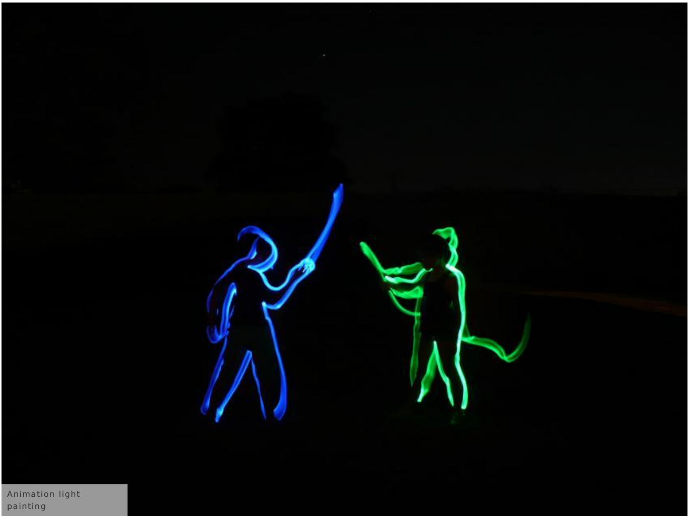
Animation light painting

Et pour partir à la découverte du coteau de Montsoreau, truffé de cavités troglodytiques, participez à un grand jeu de piste Mardi 20 juillet, de 10h à 12h , arpentez les ruelles, recherchez les indices pour percer les mystères des troglos ! Votre équipe saura-t-elle résoudre toutes les énigmes ?