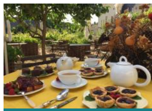
La Table des Fées