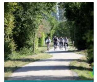
Voie verte Richelieu - Ch