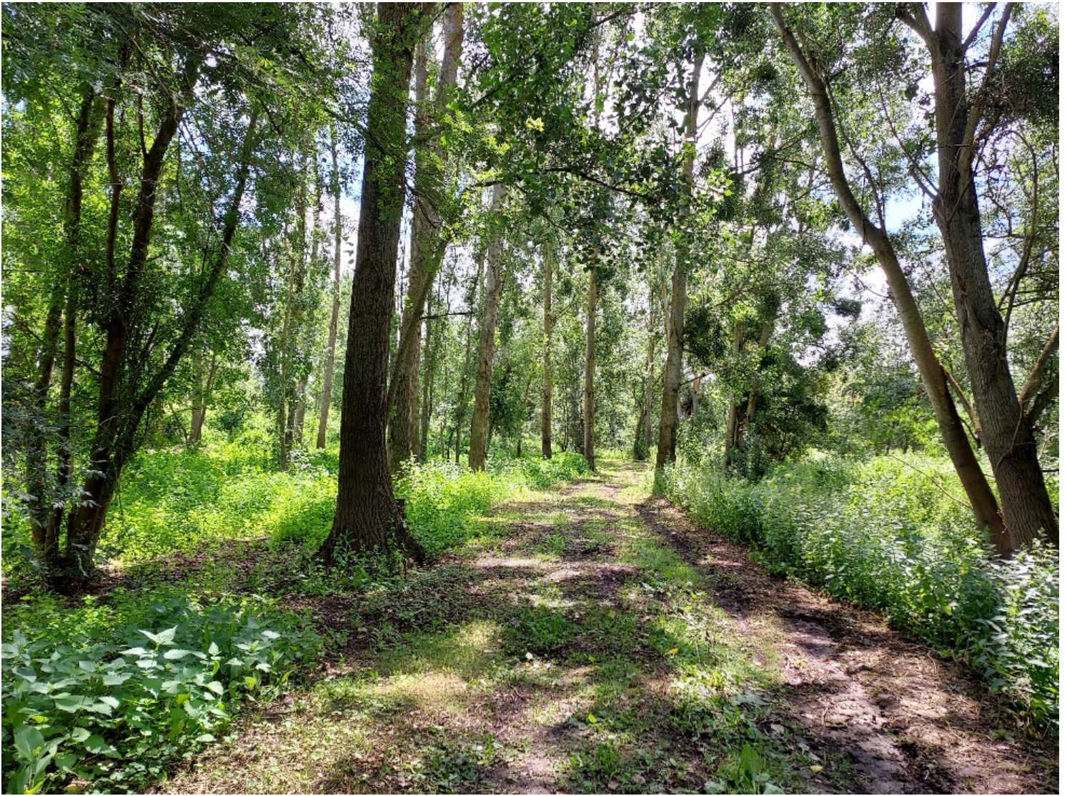
Site de la Gagnerie après travaux

Le marais de Baffou, situé sur la commune déléguée de Brézé, a déjà fait l'objet d'une première phase de restauration en 2013, en partenariat avec le Parc. Ce bel espace naturel aménagé invite les visiteurs à découvrir la biodiversité riche.