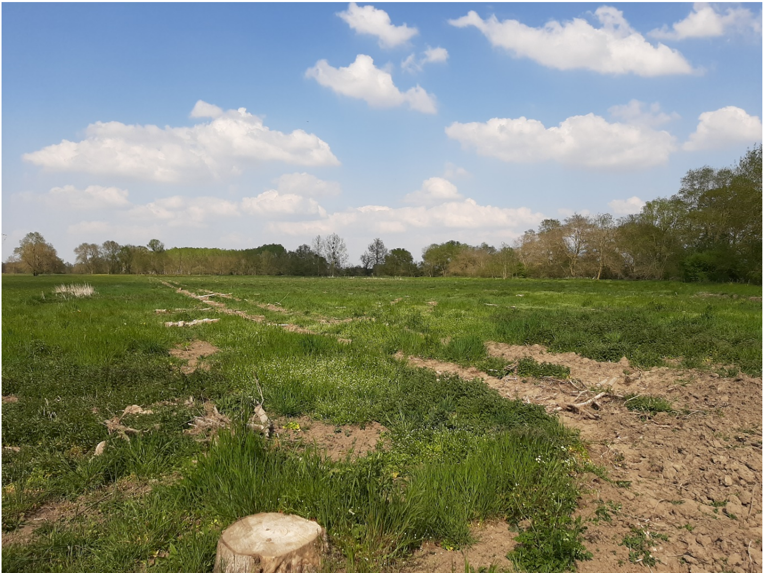
Prée de Bron avant travaux