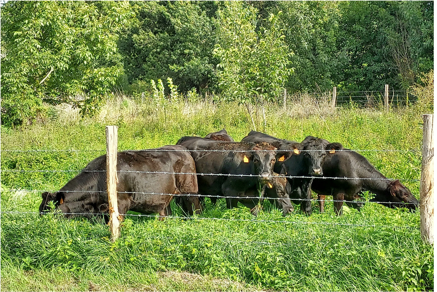
Pâturages à Montreuil-Bellay