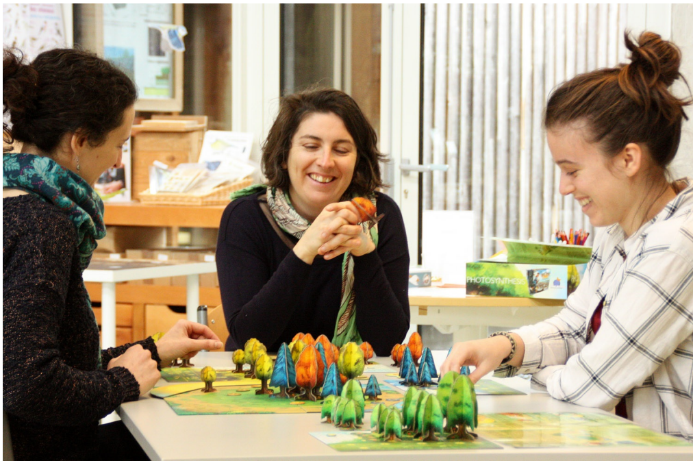
Moments de convivialité à la Maison du Parc