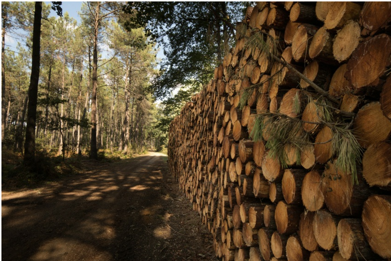
coupe de bois dans la forêt de Montreuil-Bellay

Enfin, la filière bois devra de plus en plus composer avec le changement climatique . Certaines essences qui aiment la fraîcheur (comme le hêtre ou le chêne pédonculé), ont une aire d'acclimatation qui remonte vers le nord de l'Europe. Il faudra donc adapter le choix des plantations aux nouvelles conditions. La hausse du taux de carbone favorise la pousse tandis que l'augmentation des températures et surtout le manque d'entretien des bois (devenus moins utiles), augmentent le risque d'incendies. Des plans de gestion seront donc nécessaires pour accompagner le changement.