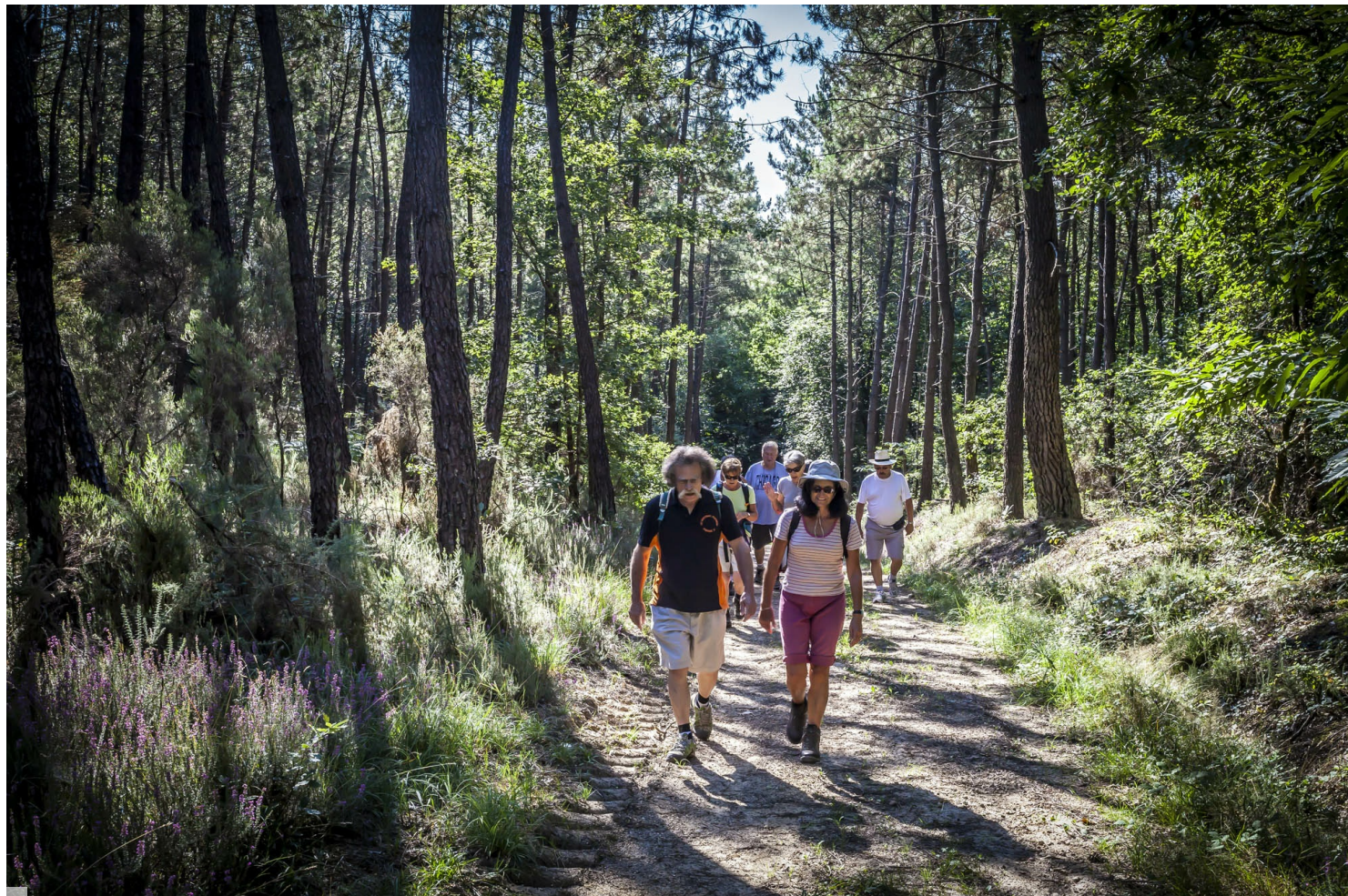
Balade en forêt

commune affiche en mairie ou sur son site Internet l'arrêté préfectoral fixant la période annuelle de chasse, et veille à ce qu'il soit facilement consultable. De leur côté, les organisateurs sont tenus d'indiquer par des panneaux temporaires qu'une battue est en cours, a minima sur les chemins et sentiers traversant la zone de chasse.