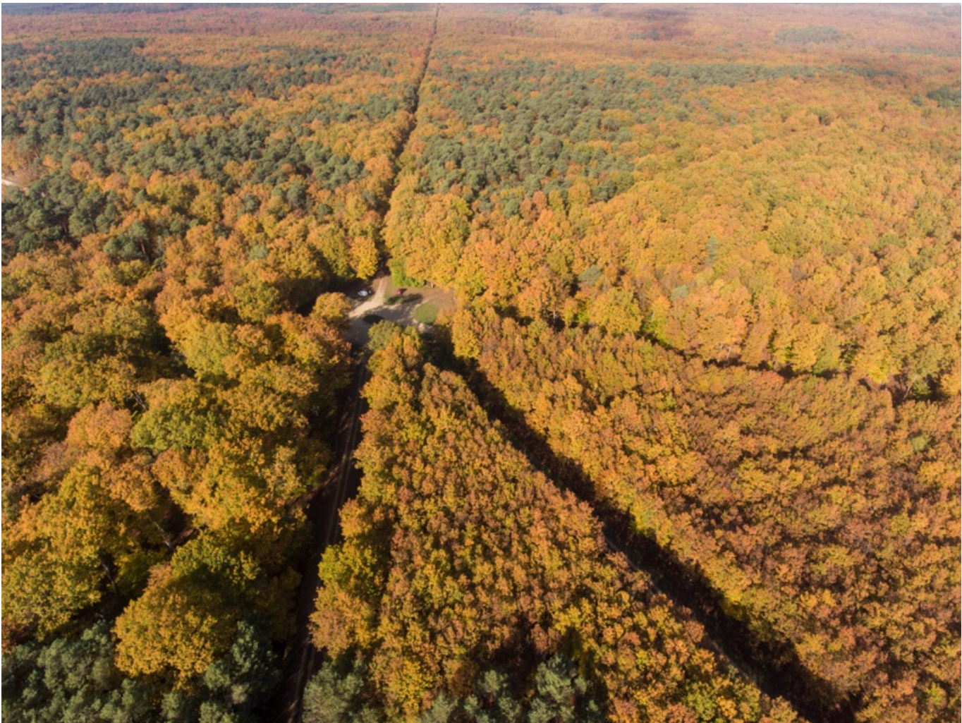
Carrefour forestier vu du ciel en forêt de Chinon