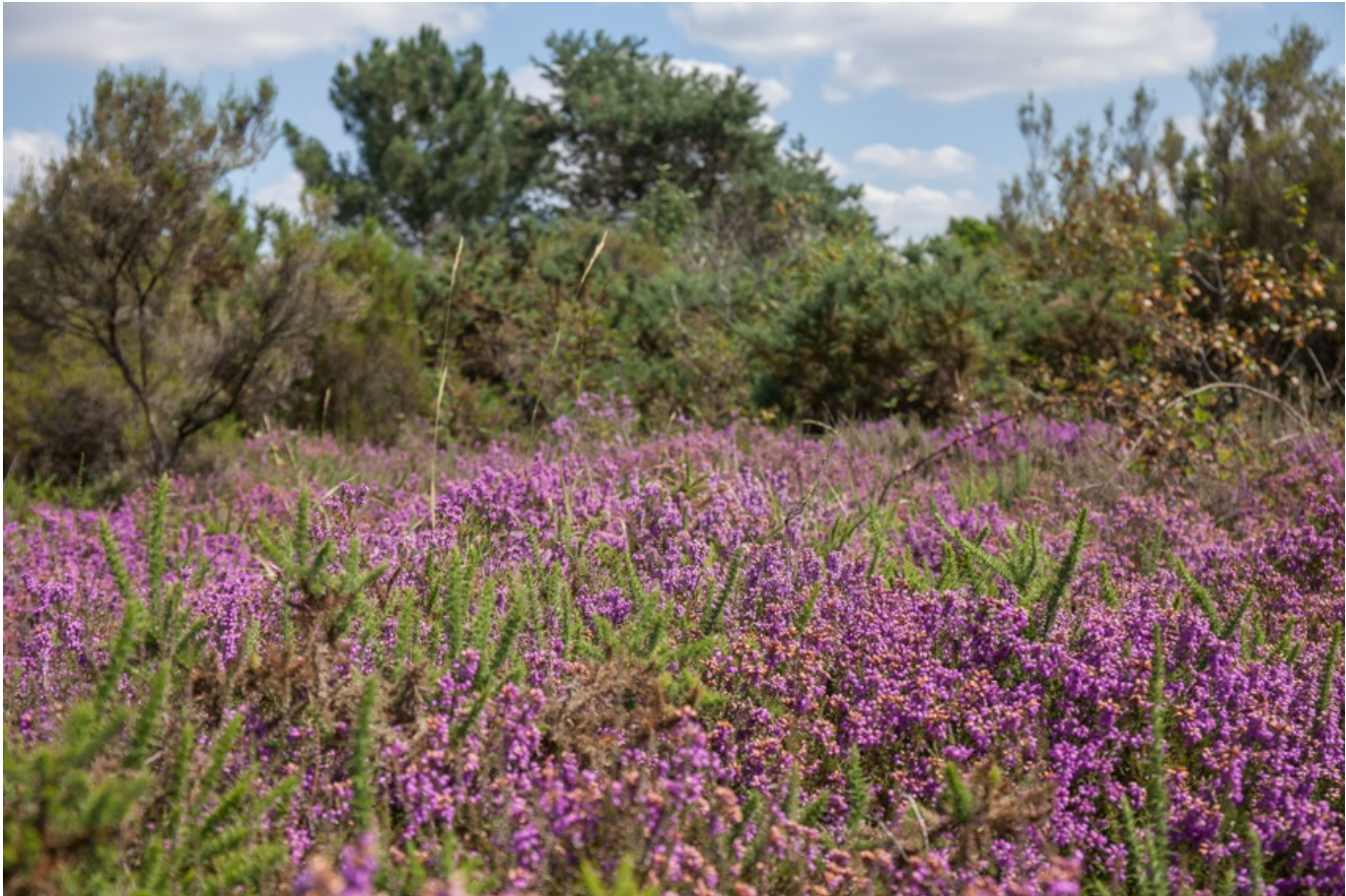
paysage de landes au camp des romains à Cinais

Où observer des landes aujourd'hui ? Vous rencontrerez ces milieux dans la forêt de Chinon ou de Milly, au Camp des Romains à Cinais, à Saint-Martin, à Langeais, et sur les plateaux boisés de la Gâtine tourangelle. Les camps militaires de Fontevraud et du Ruchard accueillent également de grandes landes dont l'accès est interdit au public.