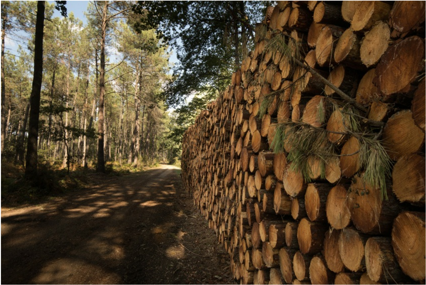
coupe de bois dans la forêt de Montreuil-Bellay

Enfin, la filière bois devra de plus en plus composer avec le changement climatique . Certaines essences qui aiment la fraîcheur (comme le hêtre ou le chêne pédonculé), ont une aire d'acclimatation qui remonte vers le nord de l'Europe. Il faudra donc adapter le choix des plantations aux nouvelles conditions. La hausse du taux de carbone favorise la pousse tandis que l'augmentation des températures et surtout le manque d'entretien des bois (devenus moins utiles), augmentent le risque d'incendies. Des plans de gestion seront donc nécessaires pour accompagner le changement.