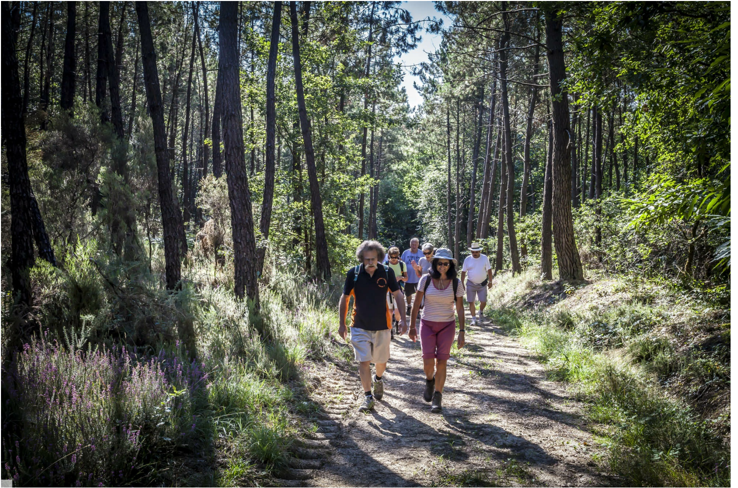
Balade en forêt