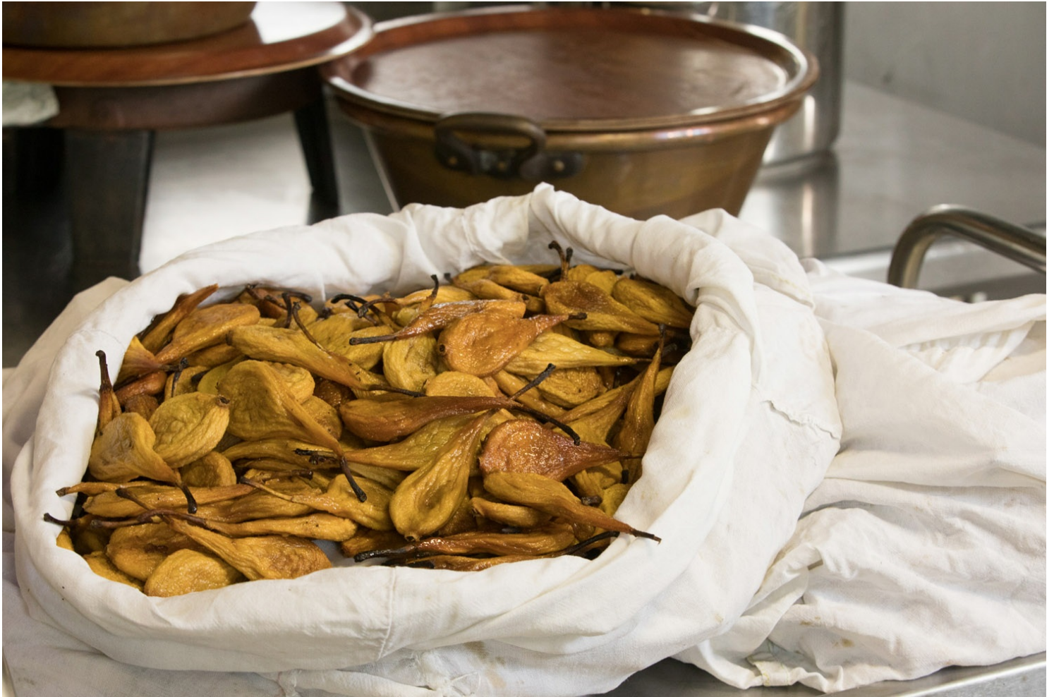
Poires tapées de Rivarennnes

À Huismes, on produisait le fameux (mais mal nommé) « pruneau de Tours ». Pour le fabriquer, des prunes de variété Sainte-Catherine étaient chauffées à 5 ou 6 reprises dans des fours, pour en chasser toute l'humidité. À la dernière cuisson, la vapeur condensait en une fine pellicule blanche, appelée la fleur, qui distinguaient les pruneaux de Tours de ceux d'Agen. Ces fruits autrefois très renommés ont vu leur production décliner après la première Guerre Mondiale. Deux anciens fours à pruneaux sont encore visibles dans la rue de la Chancellerie.