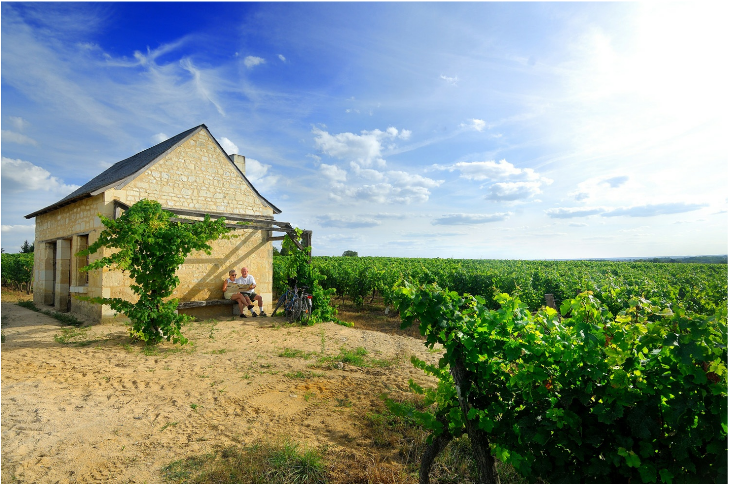
Loge de vigne