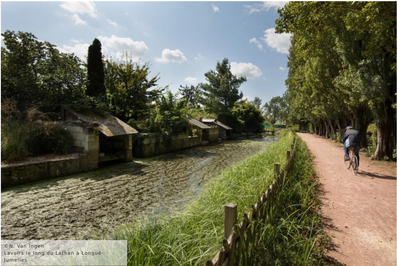
Lavoirs le long du Lathan à Longué- Jumelles