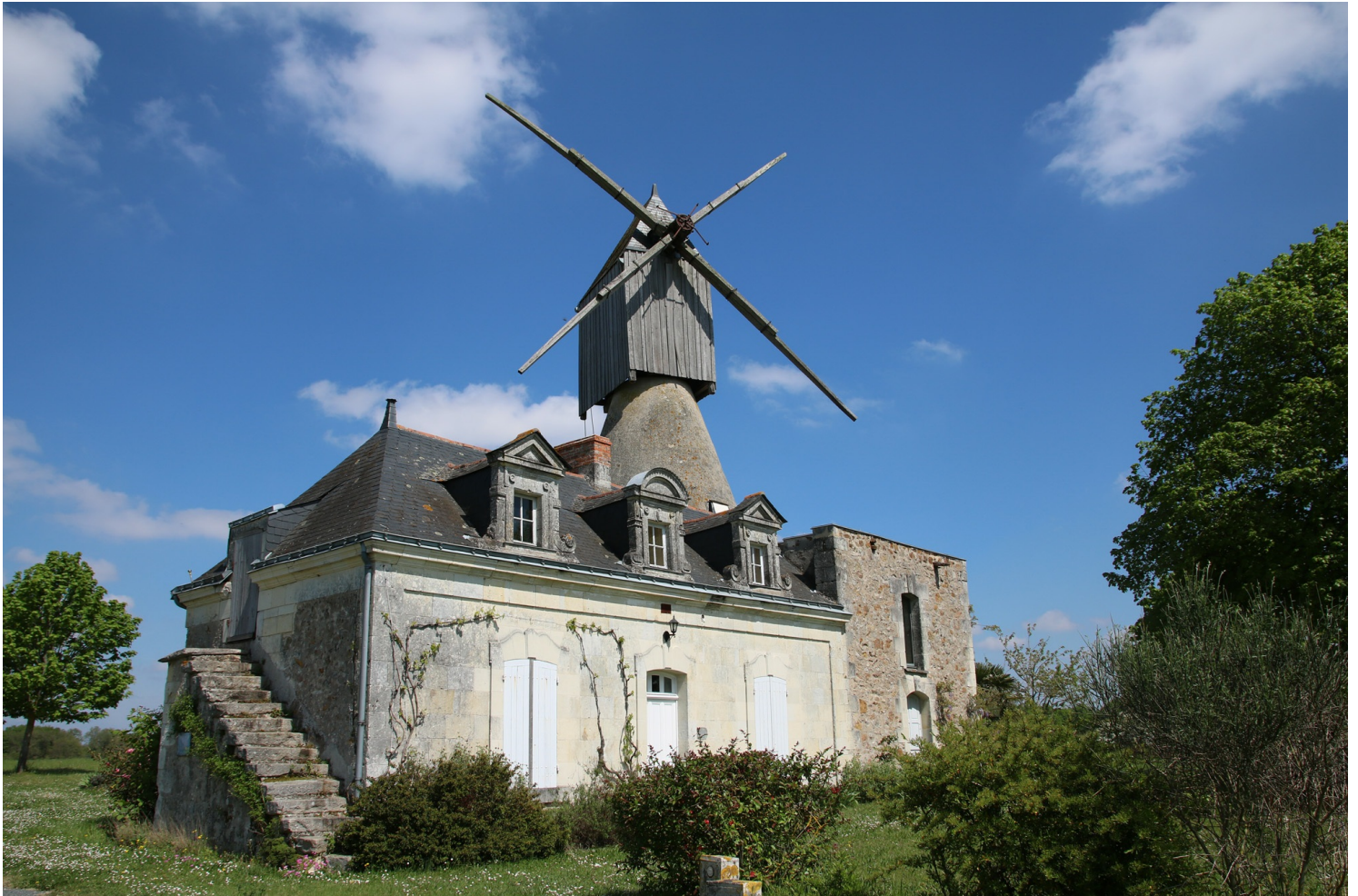
Moulin-cavier à Saint-Rémy-la-Varenne

On croise de nombreux vestiges ou spécimens restaurés sur le territoire du Parc : les mieux conservés sont Turquant, Montsoreau, Varennes-sur-Loire ou Bourgueil.