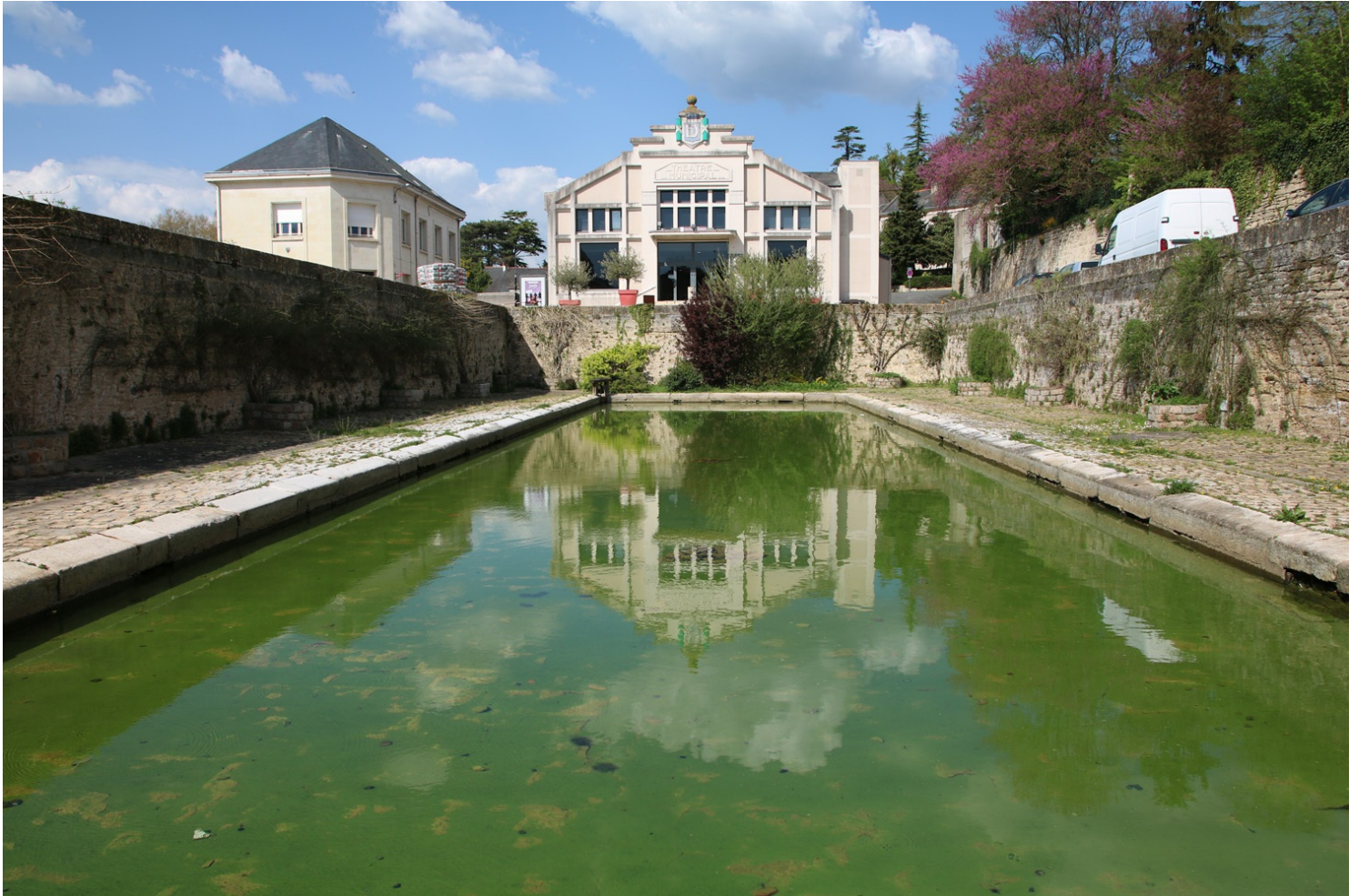
Lavoir de Doué-la-Fontaine

le linge en bas, puis on le mettait à sécher à l'étage.