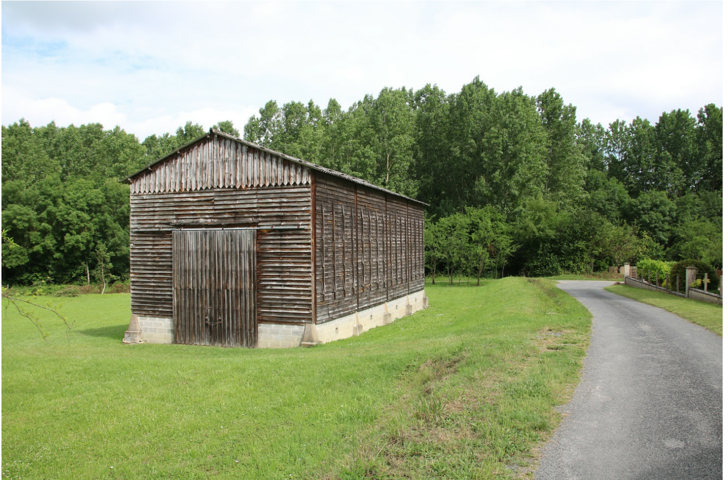
Séchoir à tabac à Huismes

Enfin, la culture du tabac est une autre production spécifique de l'Anjou et de la Touraine, dont le développement date de l'après seconde Guerre Mondiale. Dans les années 1950, le département du Maine-et-Loire est le premier producteur de tabac de la France de l'Ouest. Mais cette culture décline assez rapidement, pour disparaître dans les années 1980. Dans la campagne, on croise encore les grands hangars en bois qui servaient de séchoir à tabac à Huismes ou à Saché en Touraine.