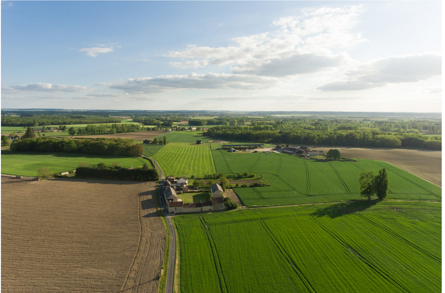
Ferme à cour carrée à Chaveignes, près de Richelieu

tandis que les communs se déploient sur les côtés.