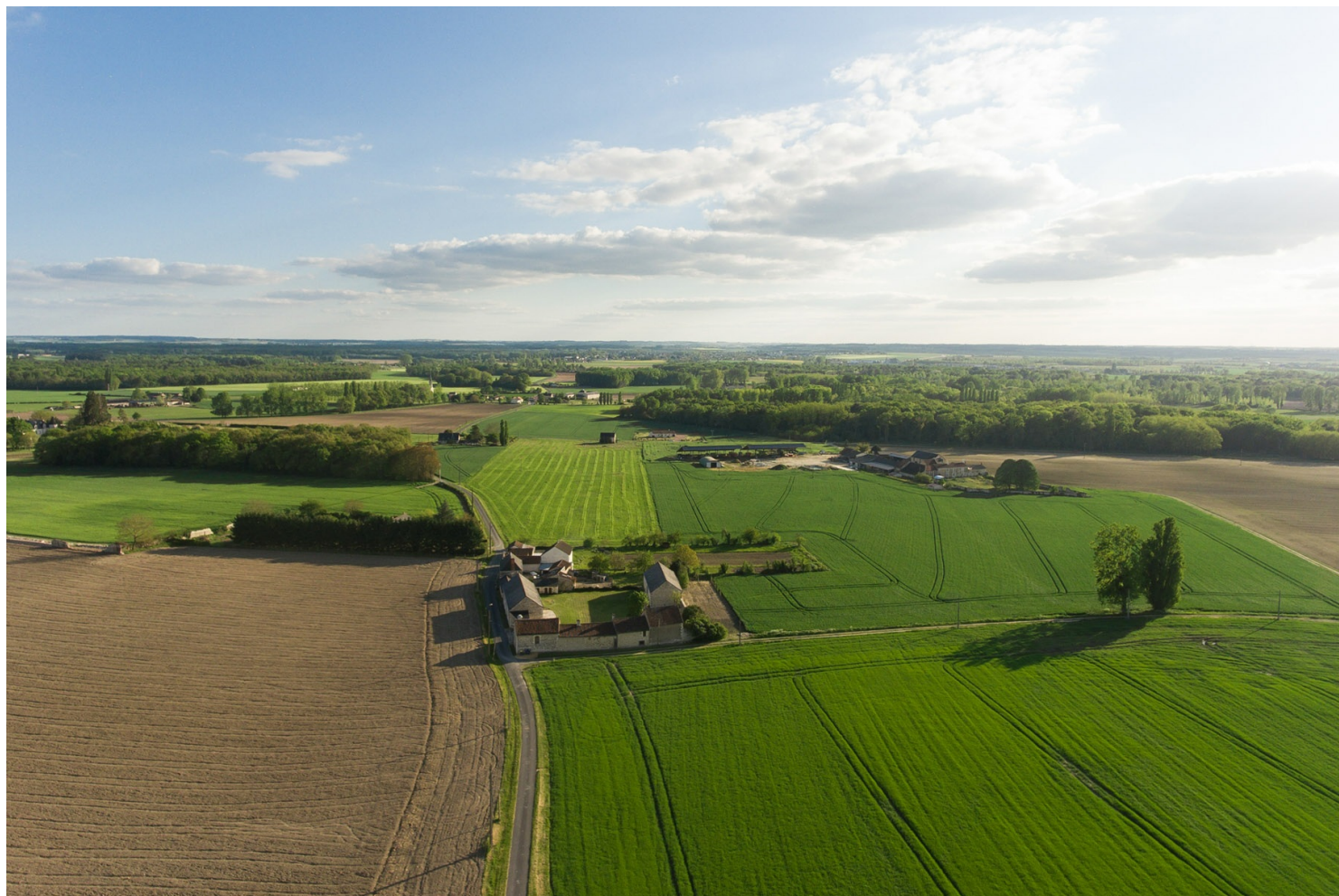
Ferme à cour carrée à Chaveignes, près de Richelieu

Dans le sud du Chinonais et dans le Richelais, on croise plutôt d'imposantes fermes carrées à cour fermée, ouvertes sur la rue par un porche majestueux, dans lesquelles on reconnaît l'influence du Loudunais tout proche. Le logement s'y trouve en fond de cour, tandis que les communs se déploient sur les côtés.