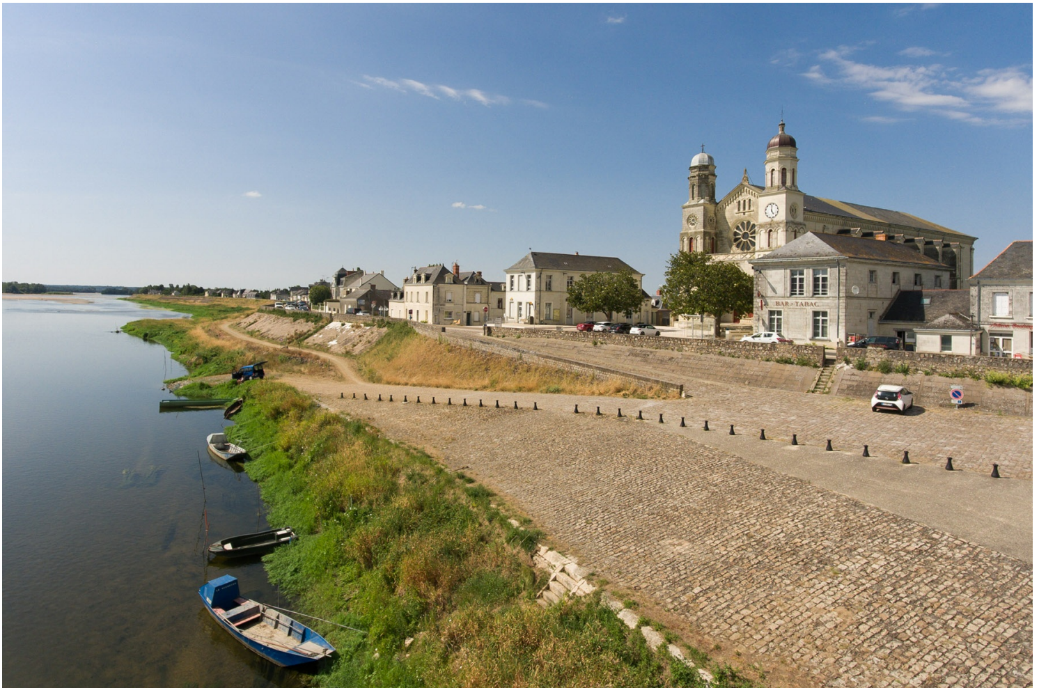
Bourg de Saint-Clément-des-Levées

En face, les bourgs ont connu une autre évolution, au gré des travaux de construction et de renforcement de la levée de la Loire. Au 19 e siècle, les aménagements portuaires modifient sensiblement le visage de la rive droite : en plus de faciliter les échanges commerciaux, les quais et ports offrent des vues imprenables sur le fleuve. Mais c'est surtout l'essor agricole de la région qui transforme les bourgs. À Bréhémont, Chouzé-sur-Loire, Saint-Clément-des-Levées, Les Rosiers-sur-Loire, La Ménitrie ou encore Saint-Mathurin-sur-Loire , les façades des maisons et édifices publics se parent de riches décorations, signes extérieurs d'une prospérité sans précédent.