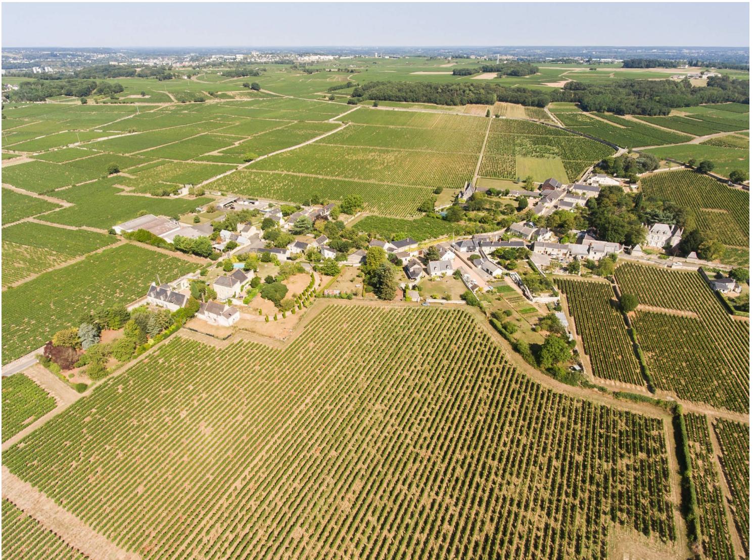
Hameau de Chaintre à Dampierre-sur-Loire

Les clos sont une spécificité locale. Ces parcelles cernées de murs dans le Saumurois restait réservé pour des questions de coût aux grands propriétaires. Les murs encore visibles dans le Saumurois, entourent uniquement les grands clos. Leur construction faite de tuffeau était aisée car la ressource abondait à proximité. L'un des plus célèbres est le Clos Cristal . Son nom rappelle celui de l'inventeur d'un mode de production original, daté du début du 20 e . Les pieds sont plantés côté nord le long d'un mur, tandis que les tiges et les fruits se gorgent de soleil au sud grâce à un trou ménagé dans le mur. Ce procédé qui améliore la maturité des raisins est toujours utilisé.