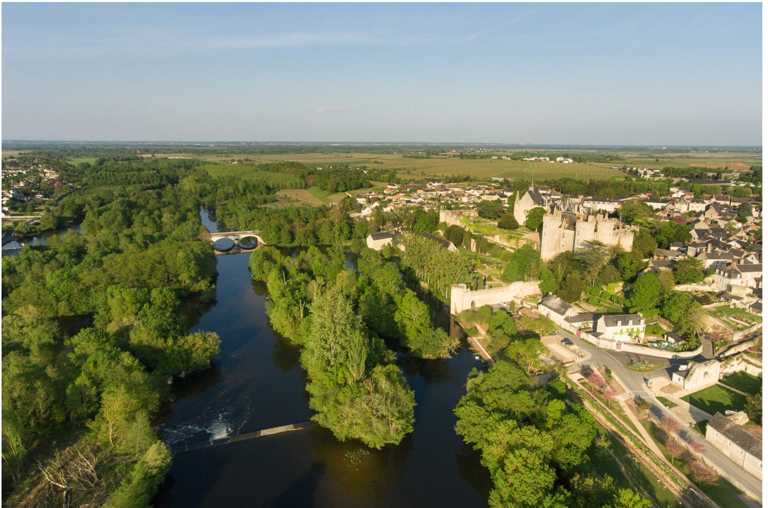
Ville de Montreuil-Bellay et son château