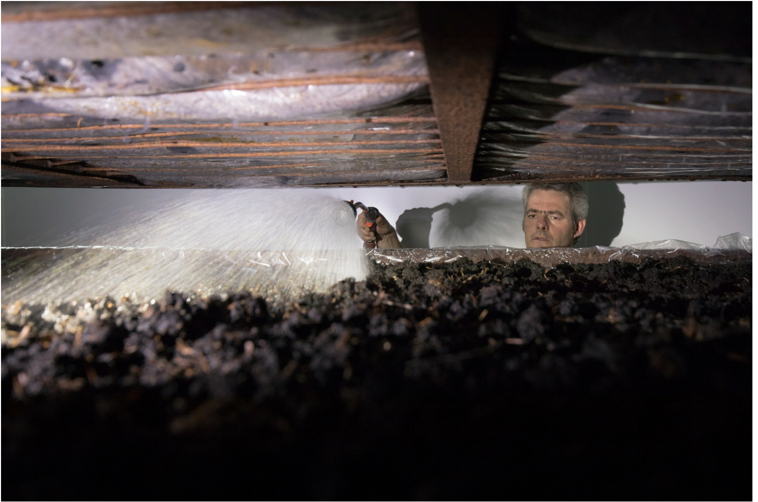
Culture des champignons - Entreprise Champi Bio à Chacé