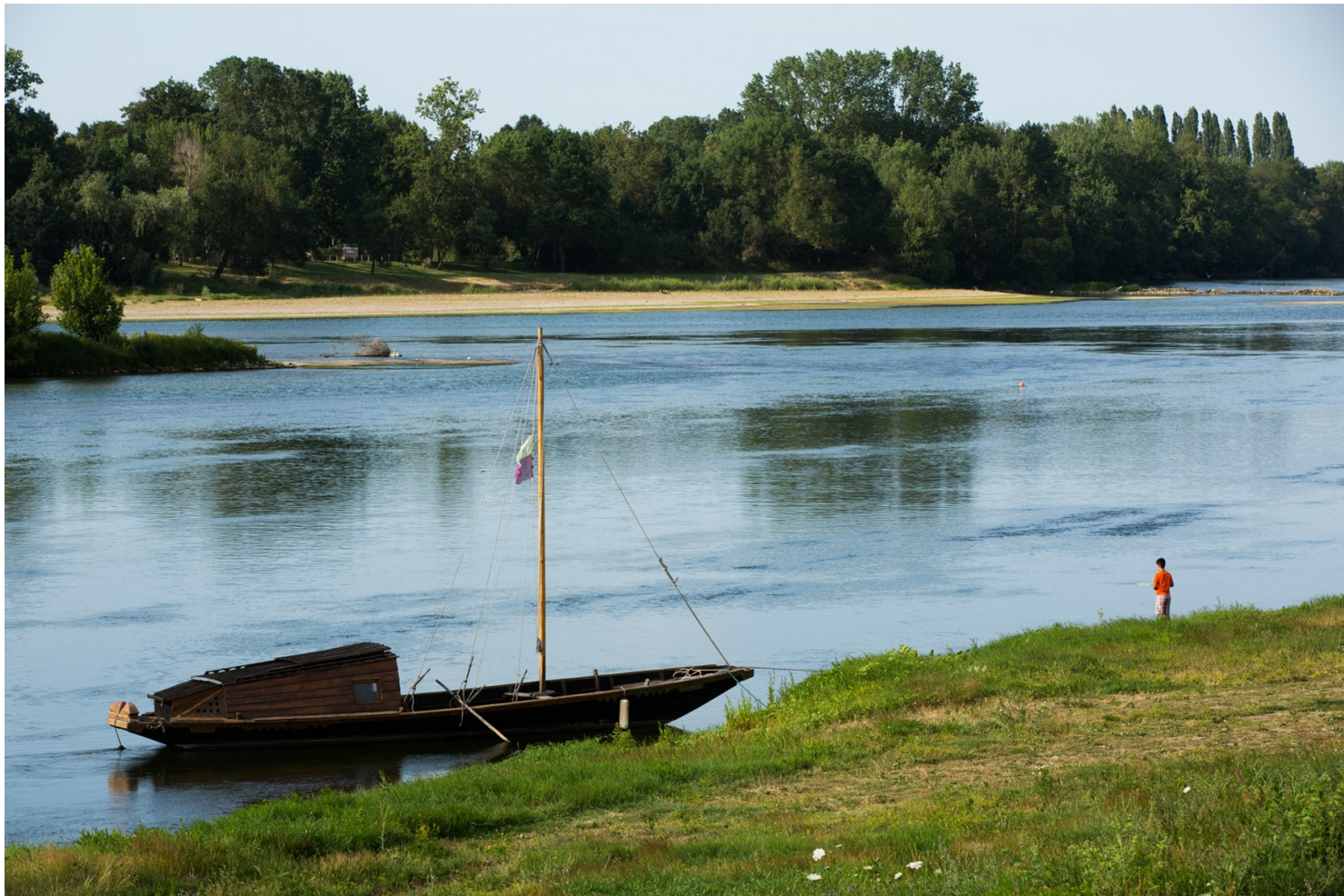
Futreau à Savigny-en-Véron

À Saumur, Montsoreau, Bréhémont ou La Chapelle-sur-Loire notamment, des activités touristiques se sont développées sur ces embarcations.