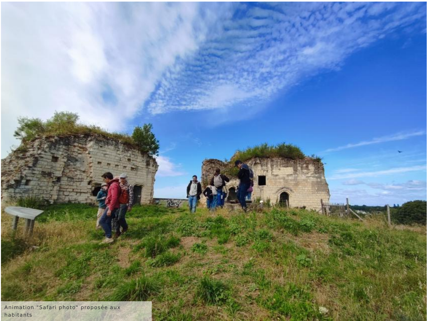
Animation "Safari photo" proposée aux habitants