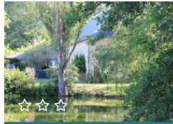
Gîte du port guyet