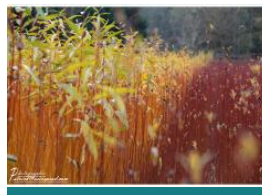
L'osier de Gué droit