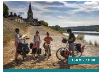
De port en port – Circuit n°19