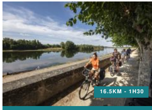
Au fil de l'eau – Circuit n°20