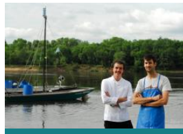
La Cabane à matelot