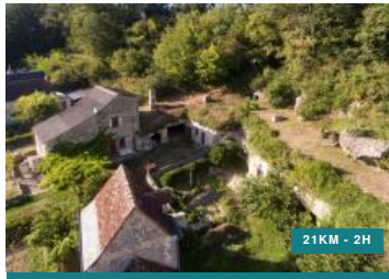
De l'osier au panier - Circuit n°18