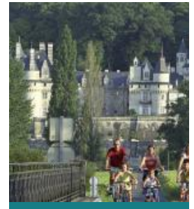
La belle au Bois Dormant