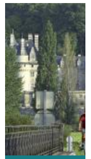
La belle au Bois n°21