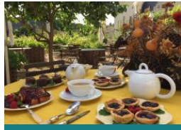
La Table des Fées