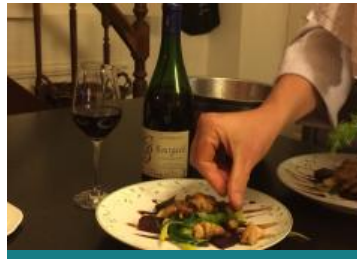
Vincent, cuisinier de campagne