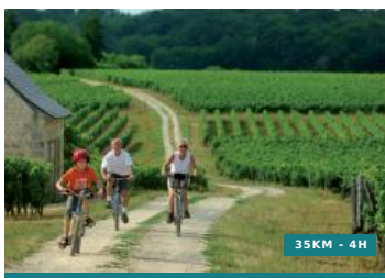
Entre forêts et clairières