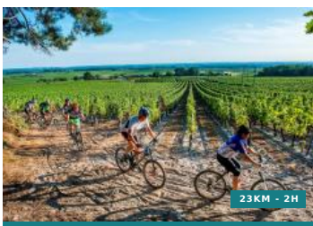
Entre vignes et forêts