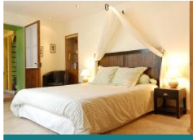
La Closerie Saint Martin