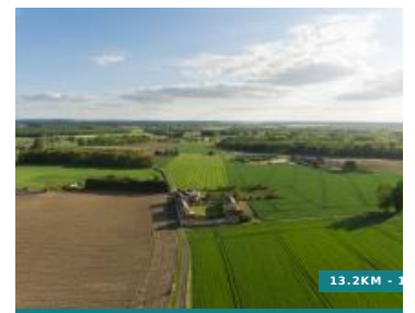
Entre Mâble et Veude - Circuit n°50