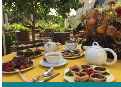
La Table des Fées