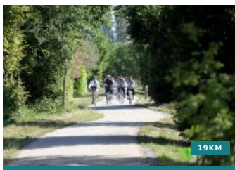
Voie verte Richelieu - Chinon