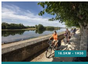
Au fil de l'eau – Circuit n°20