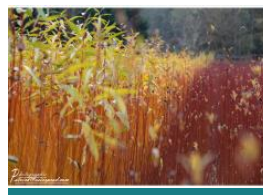
L'osier de Gué droit