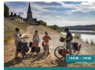
De port en port – Circuit n°19