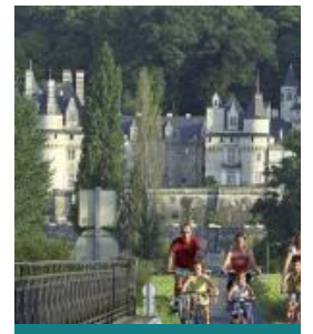
La belle au Bois Dormant