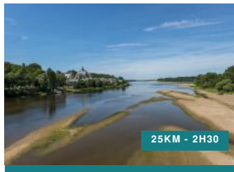
La boucle du Véron