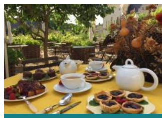
La Table des Fées