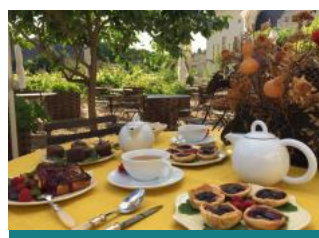
La Table des Fées