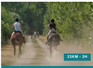
Sur les traces de Rabelais