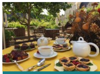
La Table des Fées