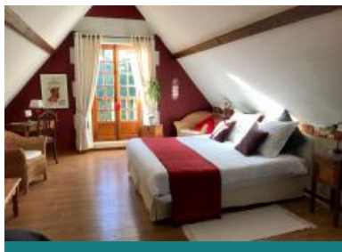
Domaine de Joreau