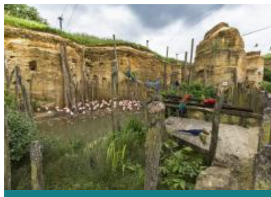
Bioparc - Zoo de Doué-la-Fontaine