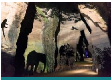
Le Mystère des Faluns