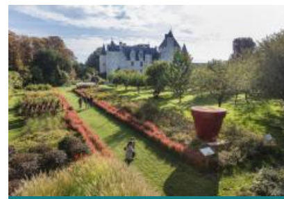
Château et Jardins du Rivau