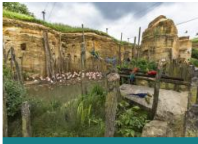
Bioparc - Zoo de Doué-la-Fontaine