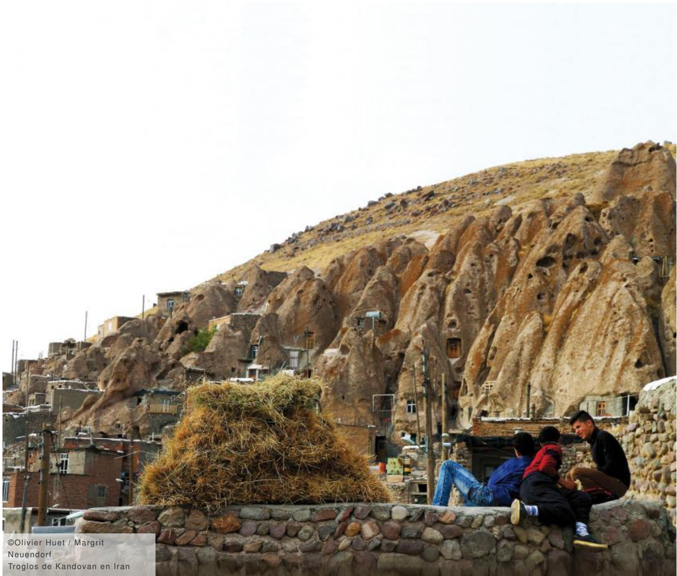
Troglos de Kandovan en Iran