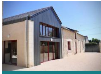
Au Logis du Prévôt