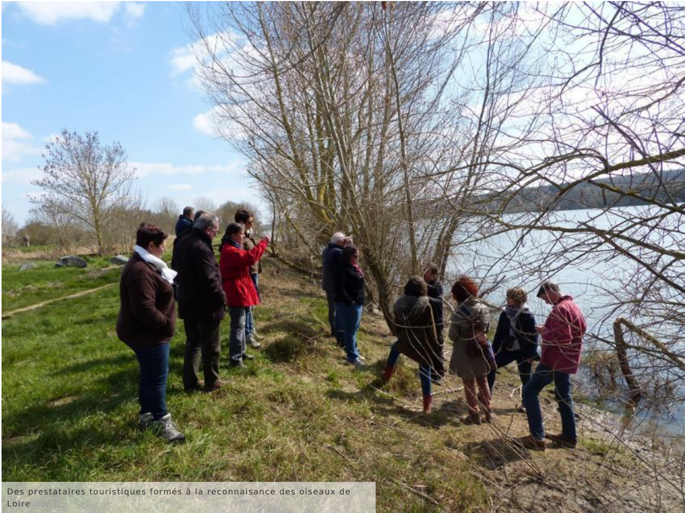
Des prestataires touristiques formés à la reconnaissance des oiseaux de Loire