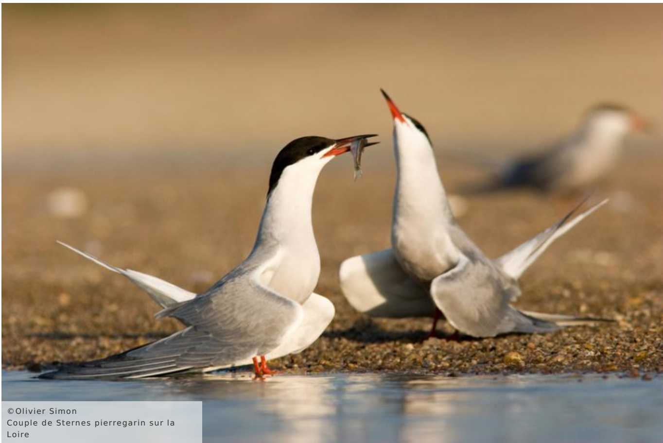
Couple de Sternes pierregarin sur la Loire

Le site Natura 2000 est aussi une zone importante pour l'avifaune migratrice, plus de 30 espèces d'oiseaux patrimoniales telles que les Sternes pierregarin ou le Balbuzard pêcheur y sont présentes et en dépendent.